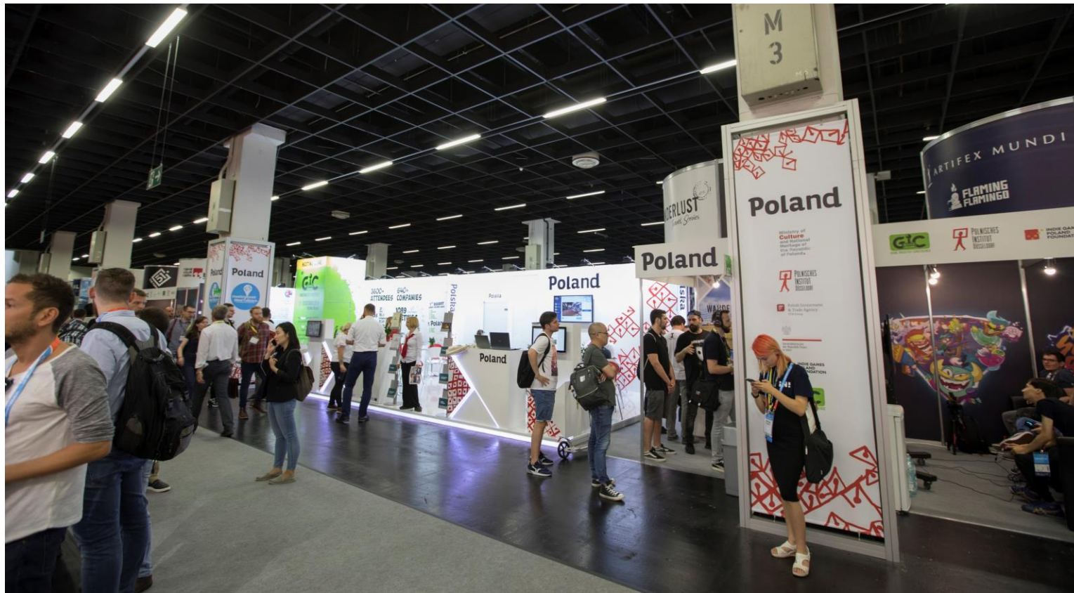
Gamescom 2019 r.