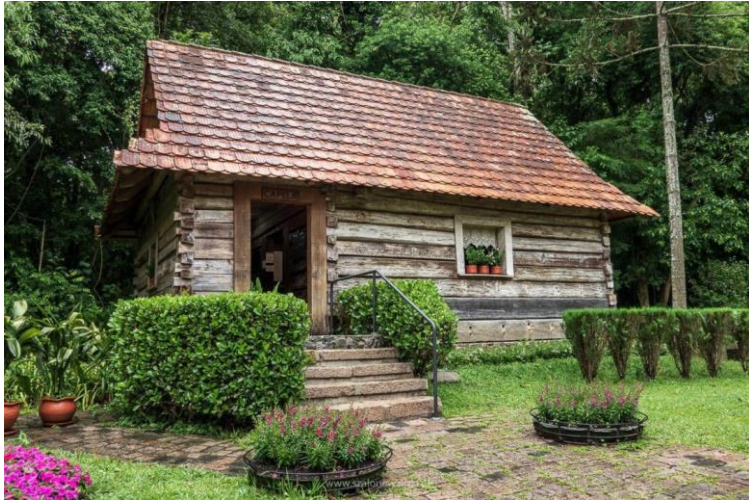
Polska chata pierwszych osadników, poświęcona przez papieża w 1980 r., znajdująca się w skansenie w Parku im. Jana Pawła II w Kurytybie

Brazylijska polonia liczy sobie ponad 150 lat, a jej głównym skupiskiem jest stan Parana.